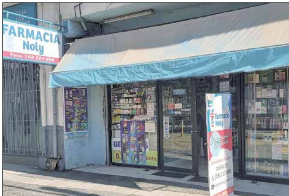
Uno de los locales comerciales asaltados en los últimos días fue la farmacia Noly ubicada en pleno centro de San Fernando.

El fiscal de turno dispuso que personal de la SIP se constituyera en el sitio de suceso con la finalidad de levantar algún tipo de evidencia que permita dar con el paradero de los delincuentes.