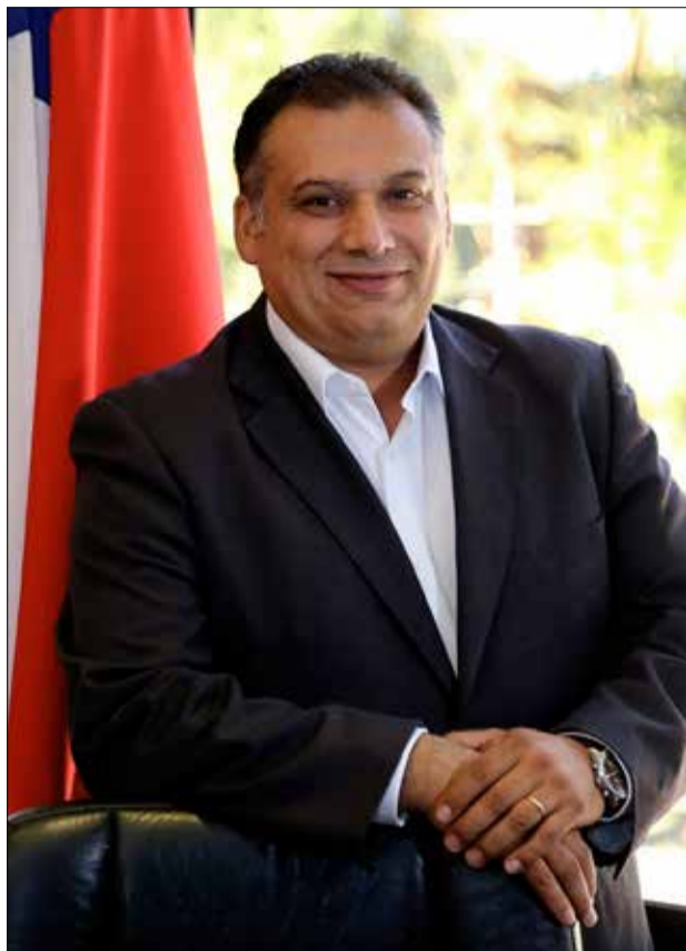
LUIS BERWART ARAYA ALCALDE DE SAN FERNANDO

En estos últimos meses, el país y el mundo, han debido enfrentar una de las más grandes crisis sanitarias de la que se tenga recuerdo, golpeando indiscriminadamente a todos los segmentos sociales, en especial a los que cuentan con menos recursos para enfrentar la pandemia del Covid-19.