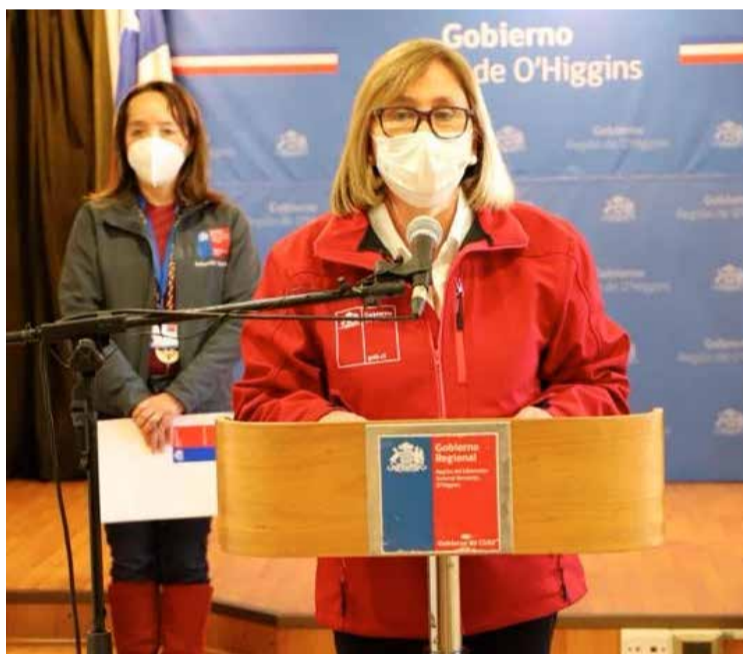
Las autoridades regionales informaron 10 nuevos fallecidos y 103 casos nuevos en el reporte diario del avance del Covid-19 en la región de O'Higgins en las últimas horas.