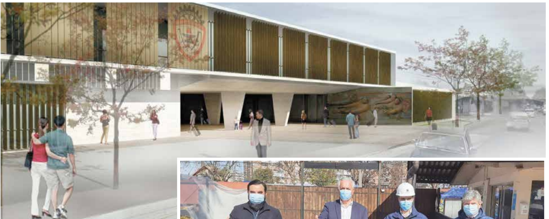
En acto simbólico se hizo entrega de terreno a empresa constructora